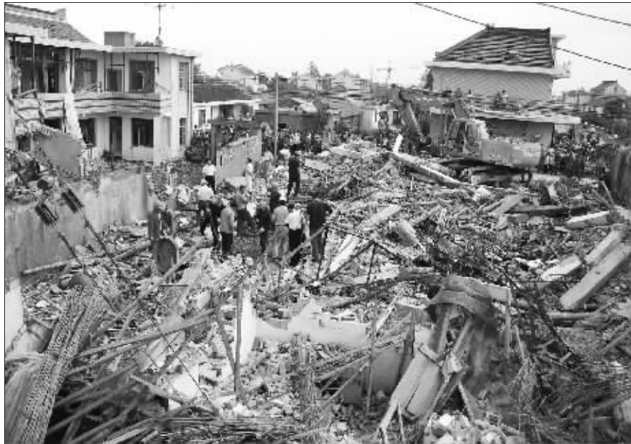
二层小楼已被爆炸夷为平地