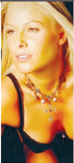
“Eye Candy Caddies”公司的高尔夫球童