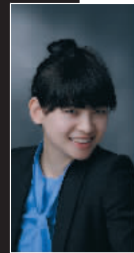
爱勤 植村秀彩妆师

中国人自古以来倡导的是以自然为美的审美观,可是随着西方文化观念的传入,越来越多的人接受化妆是一种礼仪,是尊重人的思想。职业妆是都市女性必备的一种装扮,它不同于舞台妆,它要求淡雅含蓄,妆面效果自然,要达到亮丽中不失庄重,表现的是职业女性的理智和成熟。