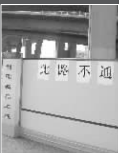
这里的围挡被临时拆除