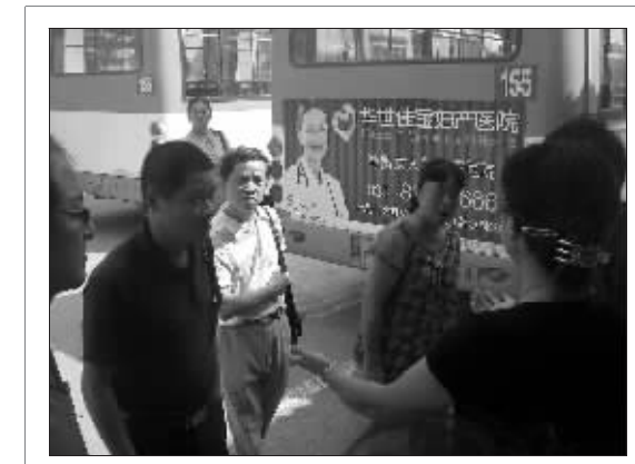
公交工作人员正在向愤怒的乘客解释