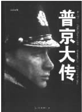
丁志可 著 中国友谊出版公司友情推荐