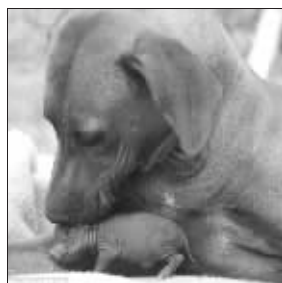
狗妈妈，温柔呵护小猪崽