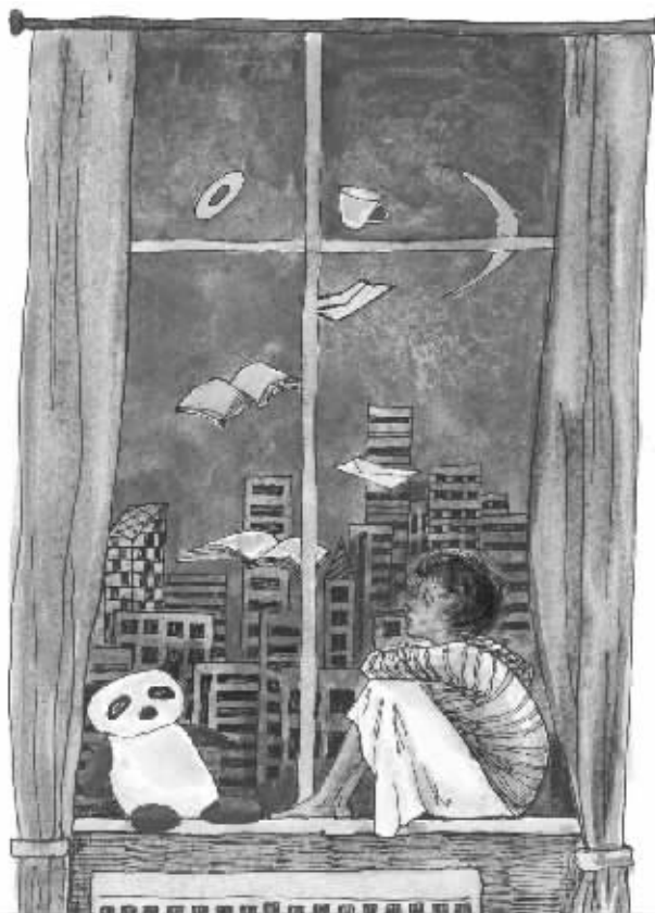
绘图/鲁嘉 插画师 美国S&S插图奖获得者 已婚

久久不能忘记,那时一起看的书,一起听的音乐... 秋天到了,还有一个月就是中秋了,但月亮离着永远不能圆满... 想象中的中秋圆月还差得很远,就像是我和他一样