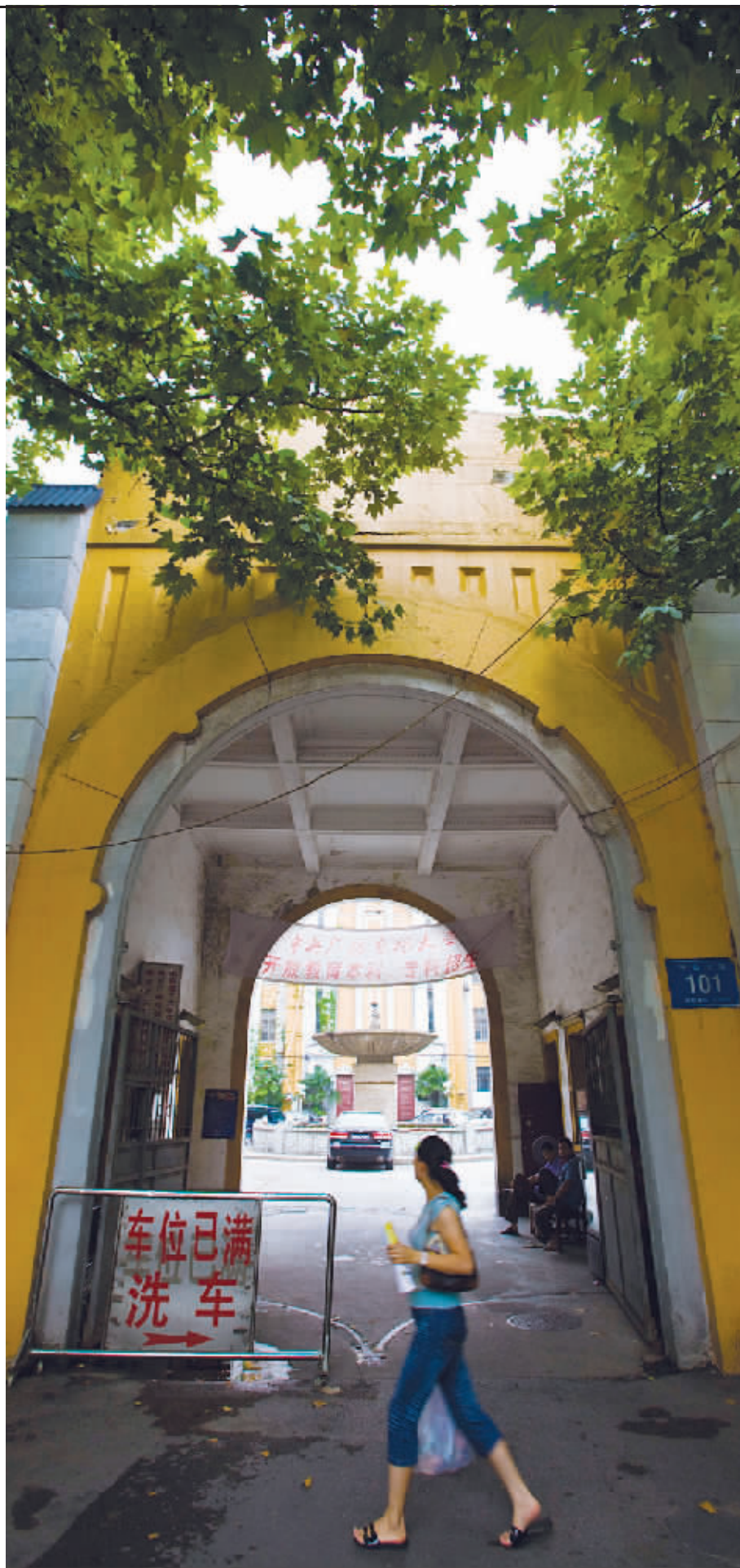
中山北路101号,建筑出自著名设计师过养默之手,经过70多年的变迁,这里的功能已经改变