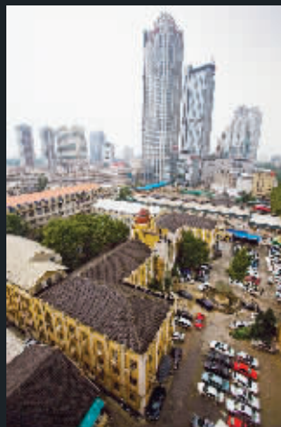
“大杂院”里少说也有上百家单位