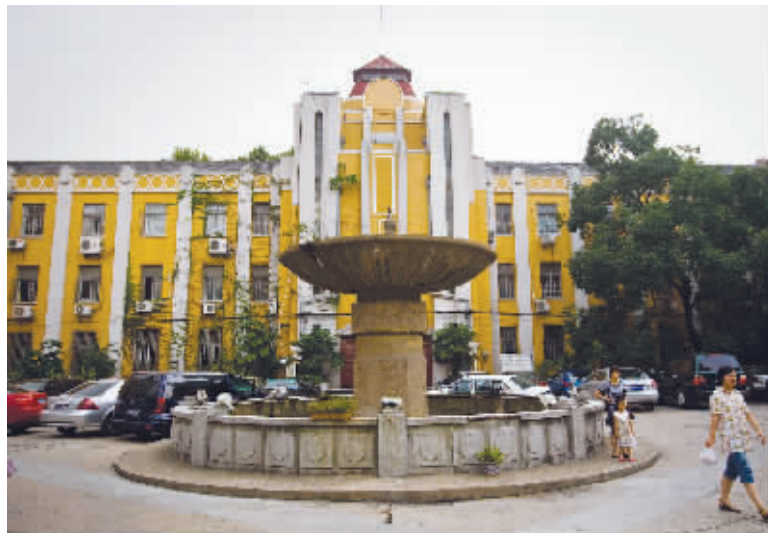
巨型喷水池象征“一碗水端平”