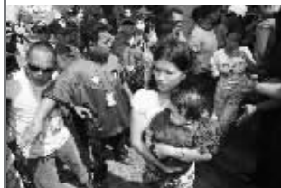
9月6日,获救人员下船上岸。新华社传真图片

当地时间9月6日,菲律宾海岸警卫队的发言人说,菲律宾一艘载有近千名乘客及船员的渡轮发生侧倾之后完全沉没,目前已确认有5人遇难,900余人成功获救,还有28人下落不明,救援行动仍在持续之中。事发之后,菲律宾政府和军方均强调,这并非恐怖主义袭击事件,事故原因正在调查之中。