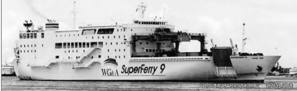
“超级渡船9”号的资料照片