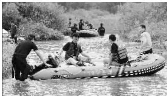
9月6日,搜救人员在韩国境内靠近朝鲜的临津江搜索被江水冲走的6名韩国人。

临津江发源于朝鲜境内,穿过“三八线”流入韩国,最后在靠近黄海沿岸处注入汉江河口。汉江洪水控制所观测结果显示,临津桥附近的水位平时约为2.3米,6日凌晨3时开始水位急剧上涨,达到4.96米。