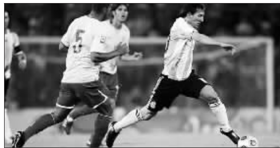
梅西(右)本场比赛的表现非常一般

昨天的比赛之前,阿根廷媒体一直强调这是一场“绝对不能输的比赛”,然而马拉多纳的球队最终还是没能从巴西身上拿到哪怕1分,而这也使得他们进军南非世界杯的难度越来越大。