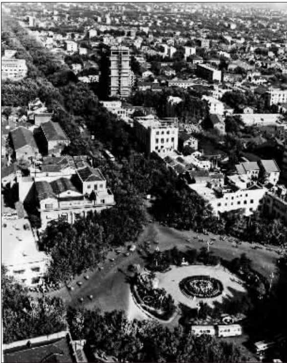
1983年的中山东路

中山东路-汉中路全线改造出新后,中间的隔离护栏拟全部拆除,改划双黄线。护栏取消后,一些压线掉头行车、行人横穿马路的情况可能会增加,这对开车人和行人都是一个素质考验。让我们用实际行动倡导文明出行,摒弃不文明交通行为,遵守交通法规,为造就安全畅通的交通秩序作出应尽的义务和责任。为此,现代快报向市民朋友们发出如下倡议: 一、斑马线前,减速慢行,不酒后开车,不超速行驶; 二、不随意变道,不压线掉头行车,不随意插队; 三、文明行车、文明停车,行车时让出应急通道,停车时让出消防通道; 四、不闯红灯,不横过马路; 五、非机动车驾驶人、行人在马路上追逐嬉戏、打闹。 快报记者 李蕾超 张星