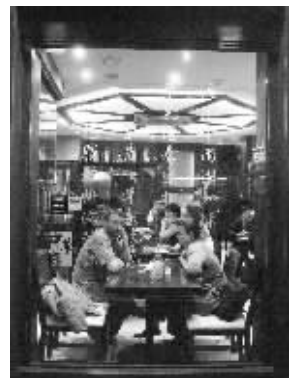
地点：伦敦 时间：2008年夏

还有一家餐馆里里外外贴满了红字，店名就叫人民公社，显然是家新餐馆，我上一次来伦敦时还不兴这个。在