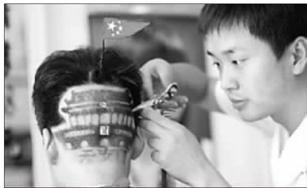
理发师正为男孩剪“天安门”发型 (截图)