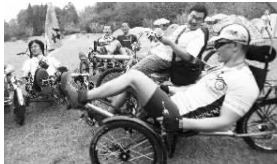
9月19日,玄武湖公园内,一群自行车运动爱好者相聚在一起,以“躺着骑车”的特殊骑行方式欣赏风景、亲近大自然。

快报讯(记者 史丽君)往年黄金周都是市民家电消费高峰期,而即将到来的长达8天的“史上最长黄金周”,家电市场将面临怎样的“盛况”?近日,五星电器公布了《十一黄金周消费需求调研报告》。这一调研在南京、无锡、苏州、杭州、宁波、青岛、成都、郑州等重点城市展开,调研问卷共计3000份。调查显示,在家电下乡、节能惠民补贴、以旧换新、婚庆、家装、房地产等因素的推动下,今年的“十一”黄金周将呈现出更加迅猛的增长势头,10月3日,即中秋节当天,人们的购买率将达最高峰值55.8%。 调查显示,10月2日到4日