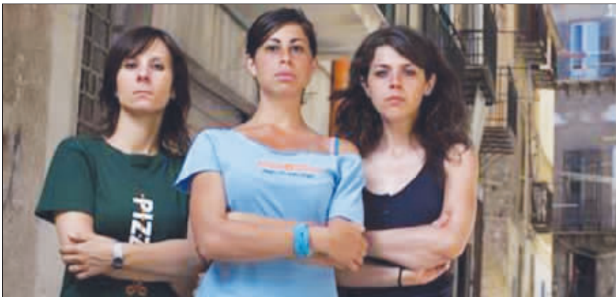
一些年轻女子结成反保护费联盟,拒向黑手党低头

意大利西西里岛一些年轻女子为保护当地商户利益,结成反保护费联盟,拒向黑手党缴纳巨额保护费。抵抗黑手党运动运作已5年,遭遇重重困难,但已初见成效。