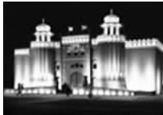
巴基斯坦国家馆效果图

江苏省世博办有关人士则介绍,“世博会期间,江苏在园区内会举办一个5天左右的‘江苏周’。”“江苏周”是为了展现“文化江苏”的风采,将组织有江苏特色的艺术节目进行演出,还有“非遗”、民间工艺、民俗风情的展览和现场表演等;还会推荐一些精品剧目参与“世博会”组委会组织的各类演出。预计“江苏周”期间举办的各种文艺展演活动将超过100场。同时,提请上海世博局在“江苏周”期间专门安排在世博会园区的专业剧院(场),上演江苏的舞台精品,如青春版《牡丹亭》等,力求使“江苏周”成为上海世博会的璀璨亮点。