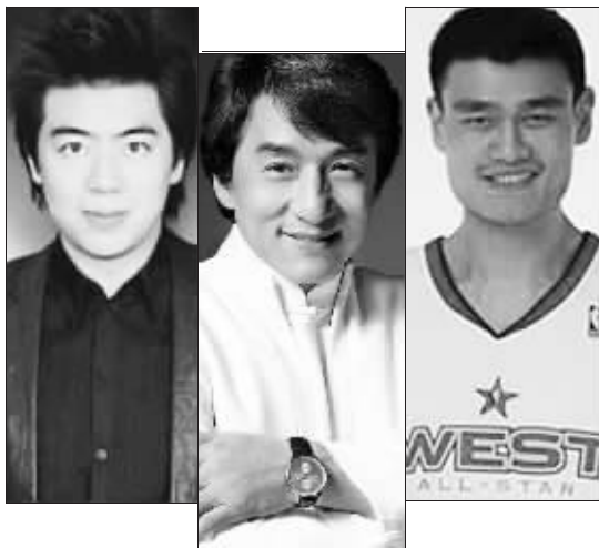
上海世博会形象大使:郎朗、成龙、姚明