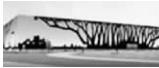
非洲联合馆效果图