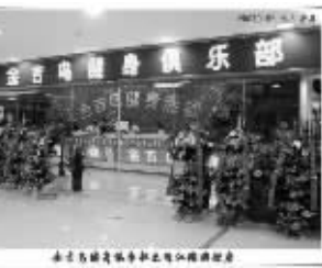
金吉鸟健身珠江路旗舰店