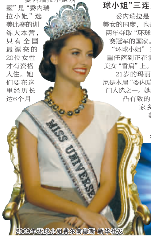
2009年环球小姐费尔南德斯