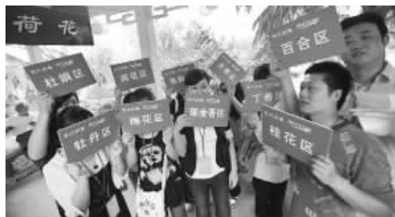
以各种花名命名的长廊让大家很有感觉

“哇,今天的长廊好温馨、好浪漫啊!”9月20日上午,期待了很久的会员们陆续来到了浪漫的集合地——玄武湖樱洲长廊。牡丹区、荷花区、丁香区,以各种花名命名的长廊以及工作人员用气球围起的互动区,让单身的朋友们一下子就找到了感觉。一位家住玄武湖公园附近的会员毫不掩饰自己的意外:“这长廊我常来,真没想到还能做出这种气氛!看来工作人员花了不少心思!”