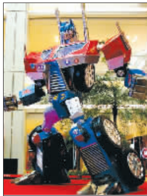
巨型擎天柱 隋鲁鲁 摄

今年“十一”期间,红山动物园动漫园将举办变形金刚展,展出近200件不同时期的变形金刚。而其中最震撼的,是一个带光电系统的巨型“擎天柱”。这个高达3.05米的大家伙究竟什么样?昨天,记者采访了它的主创人员之一、南京动漫“手办”发烧友隋鲁鲁。