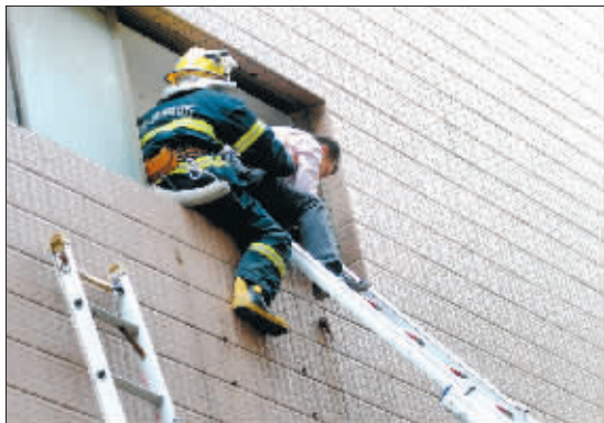
消防队员救出被困者