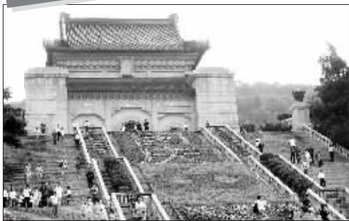
中山陵景区摆了30多万盆鲜花

快报讯(通讯员 王毅 记者 孙兰兰)第11届中国南京国际桂花节今天将在中山陵园风景区拉开帷幕。记者昨日获悉,“十一”期间,景区内除了大面积的桂花盛开迎客外,还将摆上30多万盆鲜花进行点缀,为节日造势。