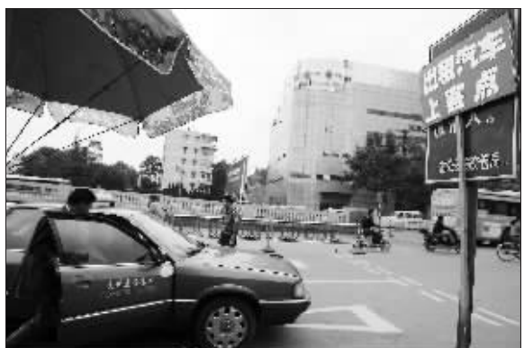
中央门汽车站出租车上客点外移

在车站的售票窗口上方有个大大的显示屏,滚动公告告诉市民“自9月21日起,恢复以下班车票价。镇江:20元(9月30日至10月1日28元);合肥:45元、48元;武汉150元;上海97元;徐州:88元、108元。”“以前,这些线路都是打折销售的,像武汉