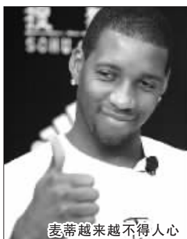
麦蒂越来越不得人心