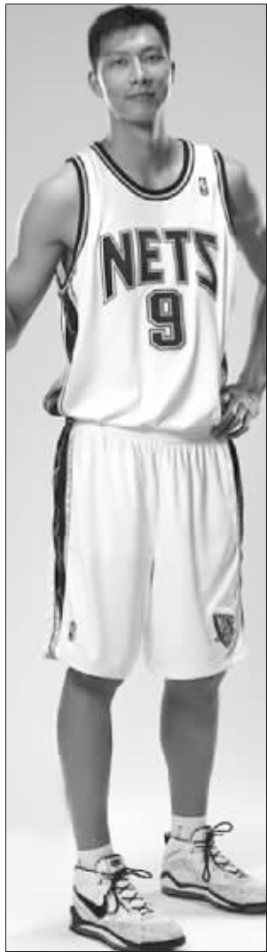
易建联将大有作为

有消息称,俄罗斯首富米哈伊尔·普罗霍夫有意注资7亿美元帮助篮网修建布鲁克林新球馆“巴克莱中心”,作为回报他将获得篮网控股权。据外电报道,昨天普罗霍夫更新博客确认了这一消息。