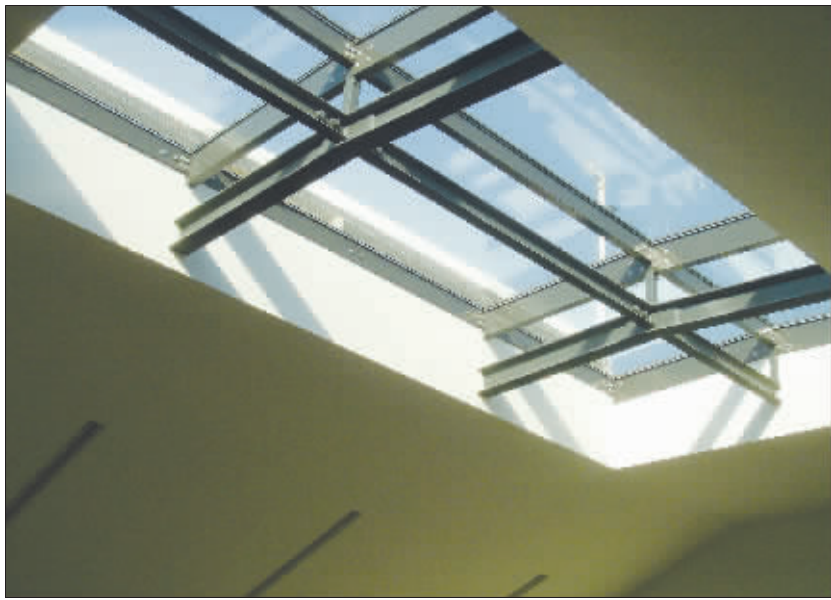
引以为豪的德国“宝马天窗”

因此，南京锋尚今年获得了联合国人居奖（中国）优秀范例奖。这一奖项设立于2008年，是继联合国人居范例奖、联合国人居署迪拜国际范例奖后设立的又一全球荣誉，主要关注城市的可持续发展和绿色生态。这次是联合国人居奖（中国）优秀范例奖的第一次颁奖，奖项包括5大类，其中在清洁能源解决方案的类别中，中国只有南京的锋尚国际公寓（社区）和深圳的招商地产摘得优秀范例奖，可见竞争之激烈、奖项含金量之高。