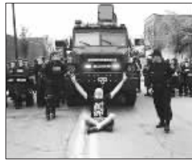
一名示威者在举行抗议活动

美国警方24日下午在匹兹堡与数百名反资本主义示威者展开对峙。由于示威未获当局批准,警方动用催泪弹和橡皮子弹驱散示威者,阻止他们靠近举行二十国集团(G20)金融峰会的会场。示威者则将垃圾桶推倒,滚着冲击警方队列。