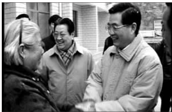
胡锦涛考察西柏坡，与群众亲切交谈 资料图片