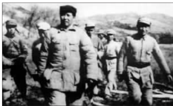
毛泽东在东移西柏坡途中 资料图片

回想这一天，马武义印象最深的就是主席说的一句话：“我们不久就要进北平！”比预想的还要快。3 月 23 日，春风送暖，阳光明媚。这一天，毛泽东将率领中共中央