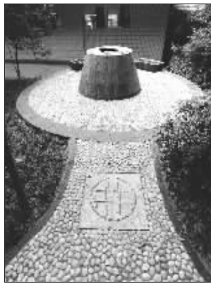
应急水井