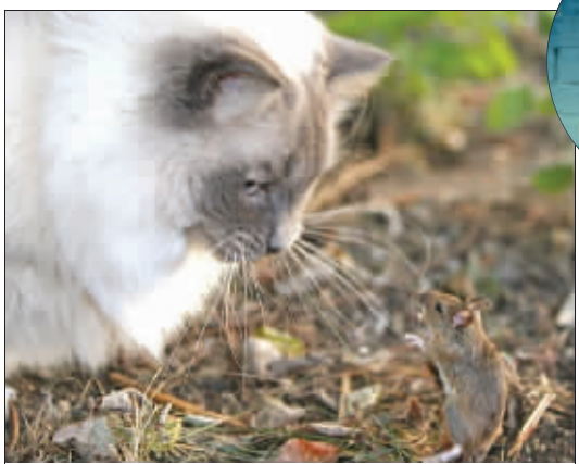
老鼠:哼!胖猫,我不怕你!