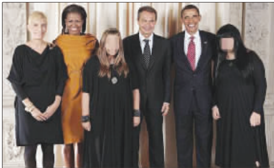
西班牙首相的两个女儿打扮成“哥特人”与奥巴马夫妇见面