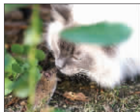
胖猫:好吧,怕你了,我后退! 设计台词