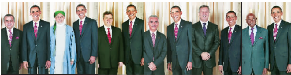
美国网友贴出的一系列照片中,除了合照人物不同,奥巴马的笑容就像一个模子里印出来一样

由美国总统奥巴马做东主持的二十国集团(G20)领导人金融峰会9月25日在美国匹兹堡落下帷幕。然而,在G20峰会结束后,一组反映奥巴马接待外宾的照片在美国小区网站却引起热传。在上百张奥巴马与外宾的合影中,奥巴马的微笑及身体动作达到惊人的一致,不少美国网友调侃奥巴马是一个机器人。