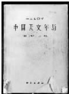
1970年的中国天文年历