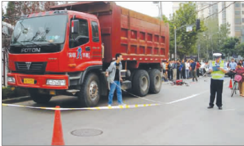
就是这辆渣土车夺走了一条鲜活的生命

这边血迹未干,那边又出惨祸。昨天傍晚,同样是在大明路,一辆疾驰的渣土车撞上一名骑车女子,造成其身受重伤,生死未卜。一天两起事故,再次将渣土车治理问题拉入公众视线。