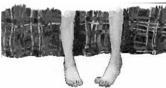
绘图/鲁嘉 插画师 美国SND插图奖获得者 已婚

脚肿了，火辣辣的痛。国庆长假期间新买了一双漂亮的高跟鞋，但是，只穿了一天，便让我明白一个道理——我天生就是穿帆布鞋的命。就像我们对爱情的美好憧憬，但最终还是敌不过残酷的现实。