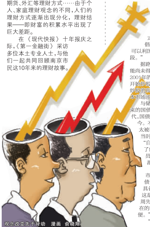
观念改变先于行动 漫画 俞晓翔

在《现代快报》十年报庆之际,《第一金融街》采访多位本土专业人士,与他们一起共同回顾南京市这10年来的理财故事。