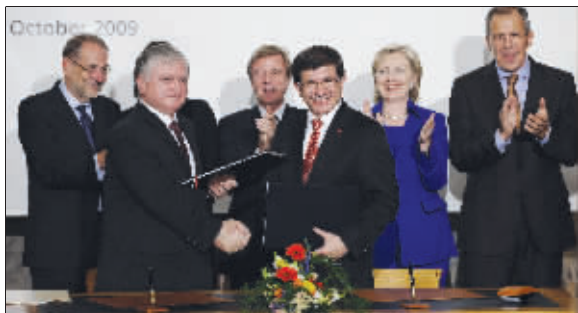
亚美尼亚外长纳尔班江(左二)和土耳其外长达乌特奥卢(右三)在签字仪式上,希拉里在两人身后微笑鼓掌

由于对土耳其奥斯曼帝国时期发生“亚美尼亚大屠杀”这一历史事件的不同看法,亚美尼亚和土耳其在过去近一个世纪时间里长期处于敌对状态,但是坚冰总有一天会被打破。当地时间10月10日晚,亚美尼亚和土耳其两国外长在瑞士苏黎世签署了实现双边关系正常化的协定,而美国国务卿希拉里在这一标志两国关系破冰的事件中扮演了极其关键的角色。