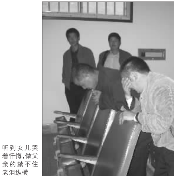
听到女儿哭着忏悔,做父亲的禁不住老泪纵横