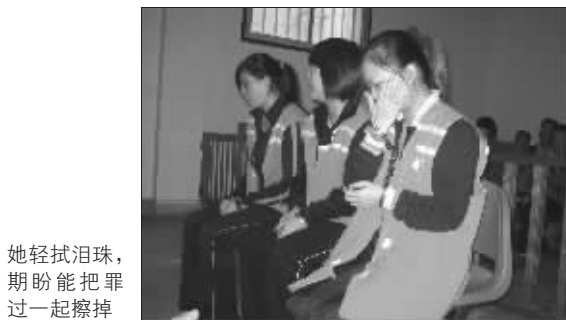
她轻拭泪珠,期盼能把罪过一起擦掉