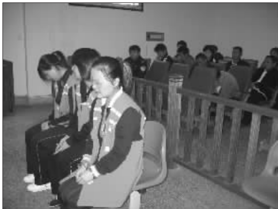
审判长刚宣布开庭,三个女孩便轻轻啜泣