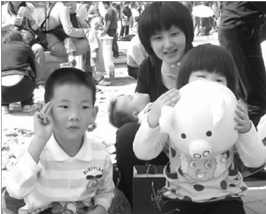
不好意思,卖错了,这个不是两块钱的……

换客真的很好玩,总结一下我们一早晨的战果,把我们几个大人都笑死了,卖了5样东西,赚了13元钱,别说肯德基了,就算付停车费估计都危险~不过没有关系,主要是带小朋友们去玩玩,去见识见识,让他们知道赚钱真的不容易,让他们学会怎么样与人打交道~这才是最关键滴~~