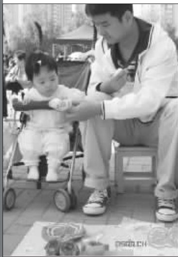
爸爸,这是我的玩具,为什么给别人??