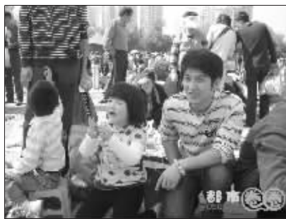
这个好东东四块钱!