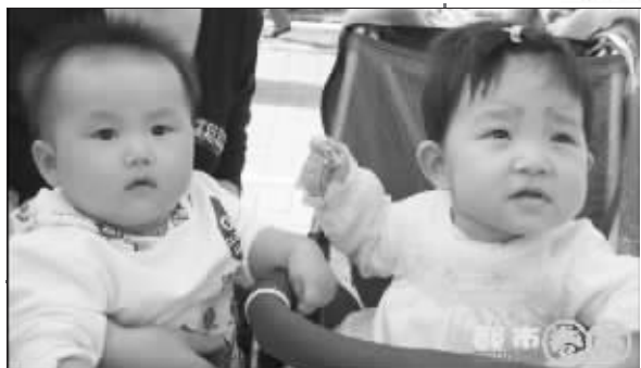
我们从《点点周刊》走来……