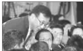
谷垣祯一 资料图片