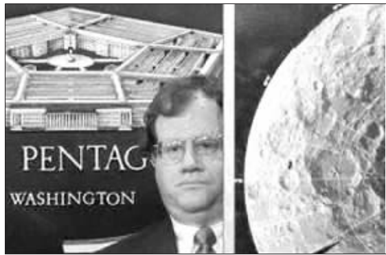
诺泽特在五角大楼出席新闻发布会时站在一幅由“克莱门汀”月球探测器拍摄的月球照片旁边。

2000年1月至2006年2月,诺泽特还通过自己成立的公司,承担了好几项由美国政府资助的高科技项目。