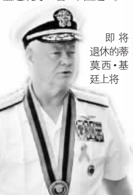
即将退休的蒂莫西·基廷上将

2007年3月26日,美国海军四星上将蒂莫西·基廷正式就任太平洋司令部成立60年以来的第23任司令。在与中方多次打交道后,基廷成为一名“中国通”。