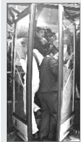
售票员好不容易才挤进车厢

公交车是上班族的首选出行工具,近日一篇《早上挤公交要疯了!摆一摆重庆最挤的公交车》热帖引来上班族的共鸣,如今点击已经上万,近600名网友回帖一吐心声。“为了上班不迟到,除了疯挤我别无选择”,公交一族的的心声既心酸又无奈。在重庆,究竟哪路公交车最拥挤?网友们根据自己的出行情况,总共提出96条候选线路。20日,记者根据网友提出的“最挤公交候选名单”,对部分公交车进行了体验。