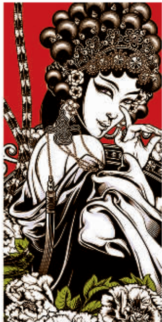
国粹主题“我爱北京”全面开拍