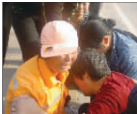
死者妻子痛不欲生

昨天早上6点50分左右,河西中央公园西侧的江东中路上,一名40岁男环卫工在清扫马路时,被身后驶来的一辆汽车当场撞死。目击者称,肇事轿车突然从道路外侧斜插向中央绿岛酿成惨剧,现场没有刹车痕迹。据了解,该环卫工的妻子也是一名环卫工,事故发生时就在旁边不远处清扫马路,目睹惨状痛不欲生。