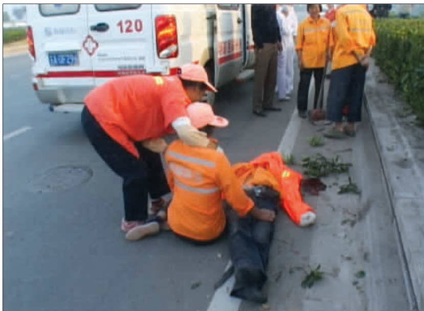
妻子坐在丈夫尸体旁边,无法接受这个事实