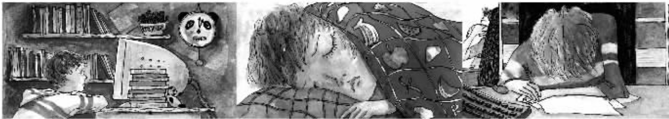
绘图/鲁嘉 插画师 美国SND插图奖获得者 已婚

大厂马小姐：爱周刊内容蛮不错的，但是本地的东西不多，只是在加减爱里提了一些本地的地点，其他的就没有了。另外，我感觉上似乎里头说的很多事情跟我们没太大关系。看着消遣消遣呢，也可以，不看呢，似乎也没什么损失。其实爱情这东西虽然说不清道不明，但总是离不开柴米油盐这些日常生活的。觉得你们还是可以做一些具有服务性的东西。