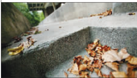
角落里的秋叶为这里更添一份落寞