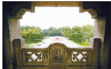
细部装饰透露出中国元素