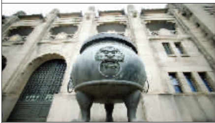
古老的铜灯上生出了斑斑锈迹