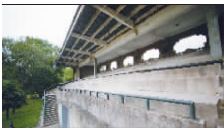
半个多世纪前,这里上演过一场体育盛会