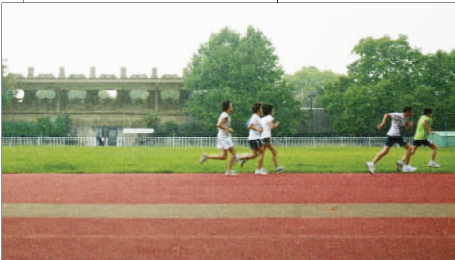
年轻的身影为耄耋之年的体育场带来了勃勃生机