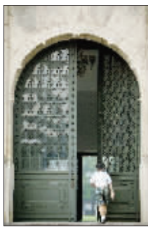
拱形花格铁门庄重而雅致