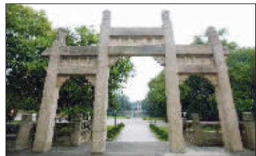
昔日的篮球场如今只剩下一座牌坊

体育场附近的游泳、棒球、跑马等赛场已经不复存在,只留下了篮球场和国术馆前的两个牌坊,威严地耸立在田径场两侧。近80年的风雨洗刷让它们呈现出古老的灰黄色,沉重而稳健。半个多世纪以来,它们一直承载着比这体育场和房屋更加古老的、沉甸甸的、国人从未忘却的体育强国梦。