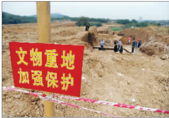
发掘王安石父兄墓的考古工地

在发现王安石父亲墓的墓志铭之后,考古人员在发掘中很快发现另一块墓志铭,而上面的记载让考古人员很兴奋,其与王安石文集集中的《亡