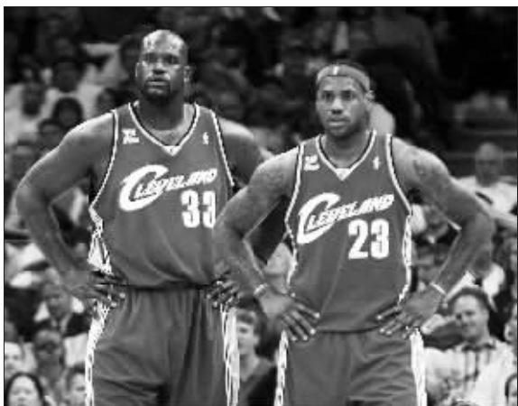
同样的姿势,同样的表情,“鲨鱼”很默契

新赛季 NBA 昨天拉开大幕,“大鲨鱼”东游让人无限憧憬“小皇帝”的总冠军之旅,然而皮尔斯显然不想成全他们。在昨天的揭幕战中,皮尔斯在第四节最后时刻连得 8 分,帮助凯尔特人在开局不利的情况下以 95:89 战胜骑士,自 2004 年末以来首次在速贷中心球场战胜骑士。正式亮相于 NBA 常规赛的首场比赛,“鲨鱼组合”没能发生化学反应,这是否预示着“小皇帝”加冕之旅注定不会顺利。