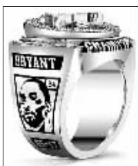
科比的头像上了冠军钻戒

在费舍尔的煽动下,昨天赛前整个斯台普斯中心都开始“3.2.1”倒数,庆祝湖人的第 15 冠。9 位前湖人队员都参加了这次庆典。所有湖人队员都穿着背后绣了 15 颗金色星星的夺冠纪念外套,然后从 NBA 总裁斯特恩和湖人二当家珍妮·巴斯手上接过戒指。