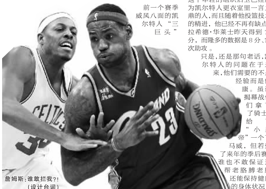
詹姆斯:谁敢拦我? (设计台制)

只是,还是那句老话,凯尔特人的问题在于未来,他们需要的不是经验而是健康。虽说揭幕战中他们拿下了骑士,给了“小皇帝”一个下马威,但若到了来年的季后赛,谁也不敢保证这帮老胳膊老腿还能保持健康的身体状况。