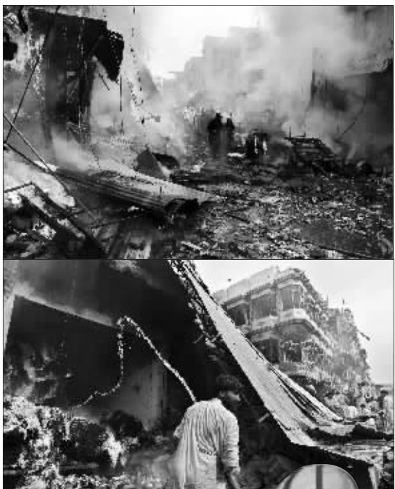
白沙瓦的爆炸现场宛如人间地狱,伴随搜救工作深入,伤亡数字可能进一步上升。