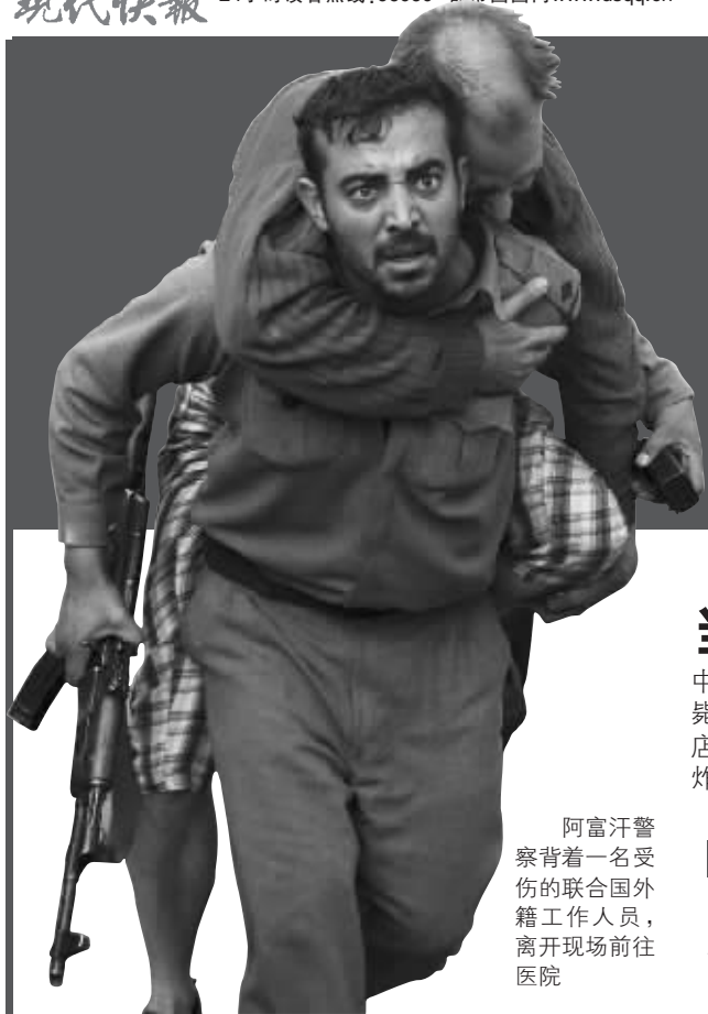
阿富汗警察背着一名受伤的联合国外籍工作人员,离开现场前往医院

■联合国驻阿机构遇袭,包括6名联合国工作人员在内12人死亡 ■一枚火箭弹落在离中国大使馆不远处爆炸,但无人员伤亡