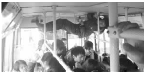
车厢内太挤,还是上面宽松点(资料图片)

《南京公交,挤尽人间百态,俺挤的不是公交,挤的是勇气!》一帖,近日在圈圈网论坛里颇有人气。南京公交拥挤一时成为圈友们热议的话题。如此拥挤的公交车有何办法应对?是否有更好的办法可以取代拥挤的公交车呢? 昨天,圈友小点点就给大家支了几招。“不刷牙,不洗脸,不洗头,不洗澡……坚持数月后即可见效。挤车时,蜂拥的人群会因你身上的恶臭而敬而远之。何愁挤不上乎?”“女用长丝袜一只,套头上。菜刀一把(也可用玩具枪代替)。对拥挤的人群大喊:‘全都趴下’(此句话要靠现场发挥)。”此外,还可以尝试以下方法——