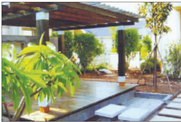
别墅的装修首先强调舒适性 资料图片

明天,江苏首届别墅大宅家装设计解析会将在宝莱纳(南京)啤酒花园盛大开幕,来自东易日盛&意德法家、科宝博洛尼、欧宝装饰、钟凯丽装饰、亚光亚老史设计工作室、天马设计工作室、瑞英设计事务所的头号设计大牌将亲临现场,与尊贵大宅业主分享大宅设计的大智慧。