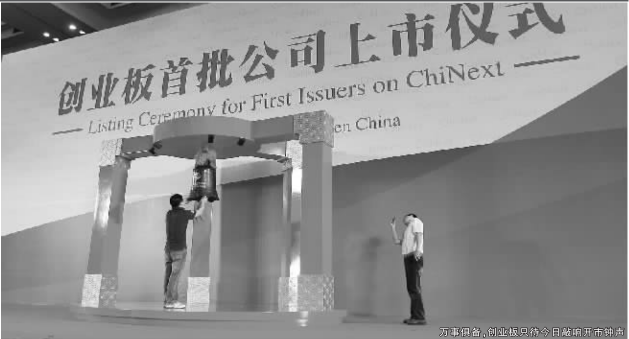
万事俱备,创业板只待今日敲响开市钟声

技巧四:概念好不好 注意公司的经营范围、所处行业、在建项目和募集资金用途,从中发现市场容易感兴趣的题材。