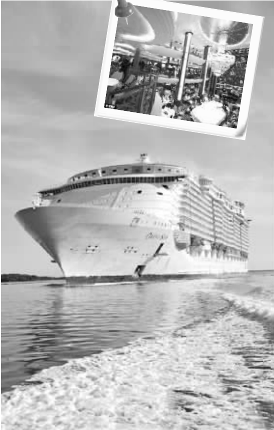
“海洋绿洲”号邮轮内部装修很豪华

皇家加勒比邮轮公司负责人费恩说,他们打造“海洋绿洲”号就是为打破人们对于邮轮的固有看法,当游客发现邮轮上有这么多事情可做时,他们会觉得坐船旅行只是次要目的。费恩说,尽管眼下全球经济不景气,但人们对乘坐这艘巨型邮轮表现出浓厚兴趣,虽然船票价格从数百美元至几万美元不等,但预订者众多。