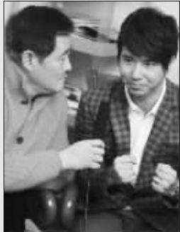
对新徒弟爱护有加