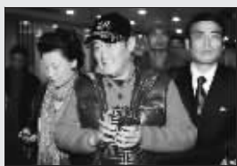
亮相节目录制现场

前天是赵本山手术“满月”的日子，本山大叔特意选择在这天首次公开露面。虽然面色红润，但赵本山坦言：坐久了就会冒虚汗，还在康复中。赵本山复工的第一件事，就是来到辽宁卫视与本山传媒合作的《明星转起来》彩排现场。彩排节目持续至19时。 台湾著名主持人欧弟前天参与了《明星转起来》的节目录制。模仿费玉清唱《千里之外》、恶搞吴宗宪唱《屋顶》、丫蛋教欧弟“二人转”……看着欧弟和徒弟们的彩排，赵本山笑开了花。 虽然没有亲自参与节目，但对于徒弟们的表演，赵本山频频作出点评，丝毫没有因为身体原因而放松要求，但对欧弟的表演却大赞。 “你看欧弟不管说什么，大家都很乐，是因为他很认真地让大家乐。”