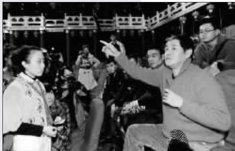
给自己的学生讲课