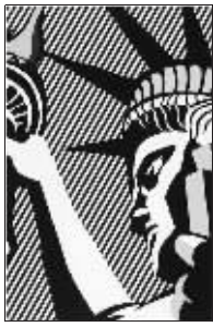
罗依·李奇登斯坦作品