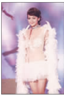
佳丽穿天使透视装